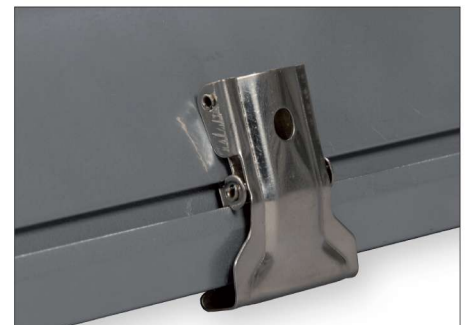
ALOX LED 2600 VZ